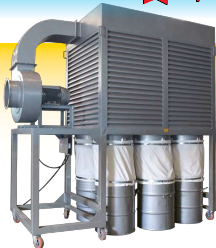
Modelo Taka - Tipo Peroba 300 (especial)