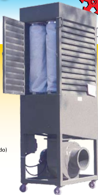
Modelo Mago Tipo Compacto 30/50 (fechado)