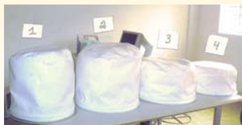
Filtro completo: aro, bag e guarnição