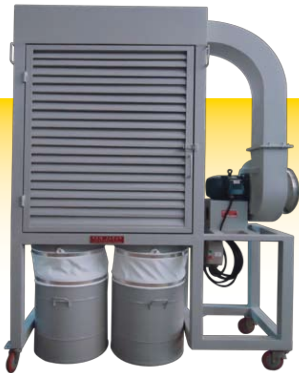
Modelo Taka - Tipo Peroba 150/200