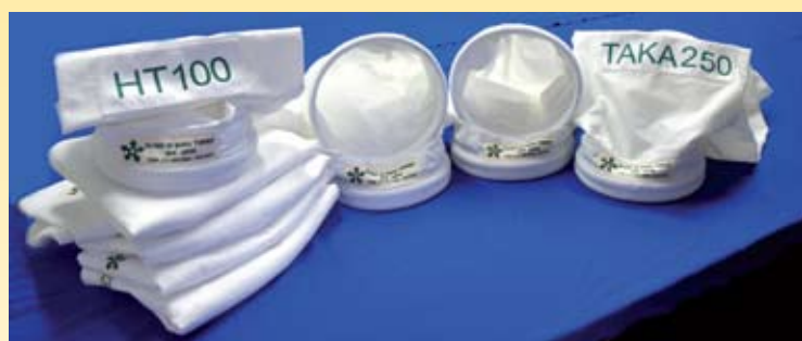
Filtros sistema de encaixe rápido para coletor de pó: TAKA, HT, MAGO e TINA