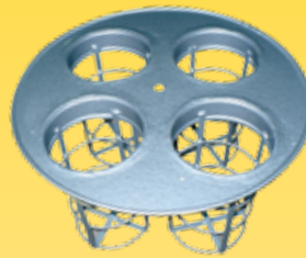
Cesto para 4 filtros modelo Vácuo