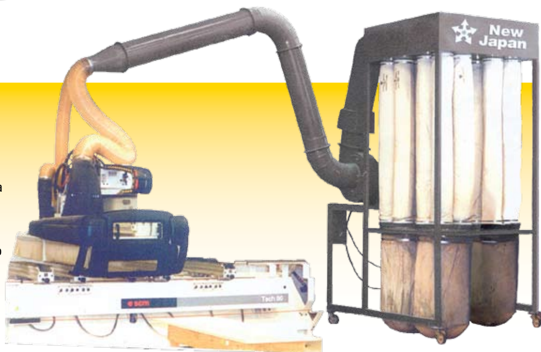
Modelo Taka - Tipo Peroba 150/200