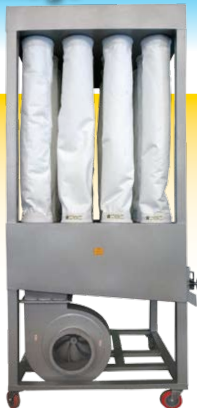
Modelo Mago Tipo Compacto 75/100