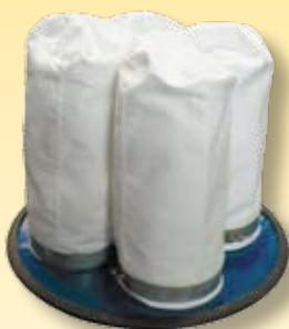
Kit completo para aspirador: Gaiolas - 4 filtros Vácuo - 70 / 77 / 80 NESS / NJ -V-75