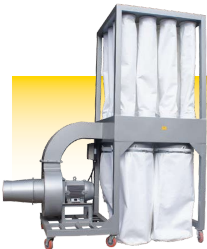
Modelo HT - Tipo Ypê 200/250