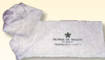
Elemento filtrante para coletor de pó