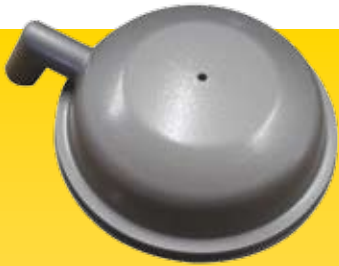
Tampa com ou sem batedor para vácuo ou aspirador