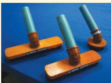
Escova: redonda, média e grande