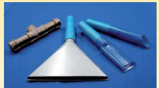
Bocal em PVC, bocal metálico triangular e bocal bico de pato