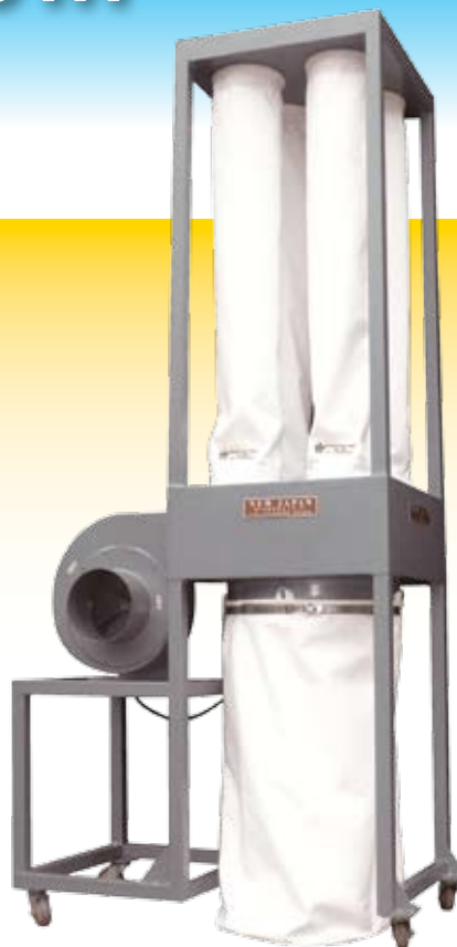
Modelo HT - Tipo Ypê 30/50