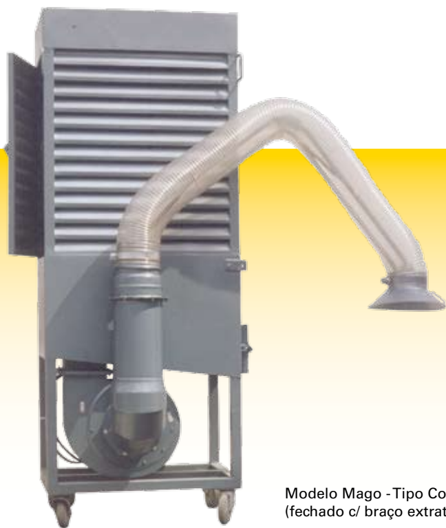
Modelo Mago - Tipo Compacto 30/50 (fechado c/ braço extrator)