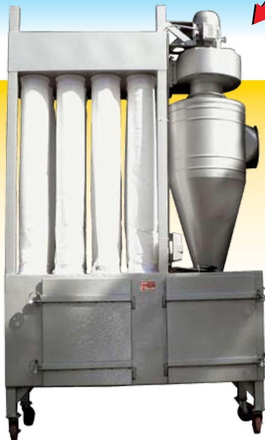
Modelo Ciclone Tipo Tina 100