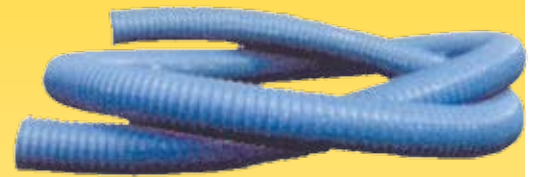
Mangueira flexível, rígida ou translúcida, em diversos diâmetros.