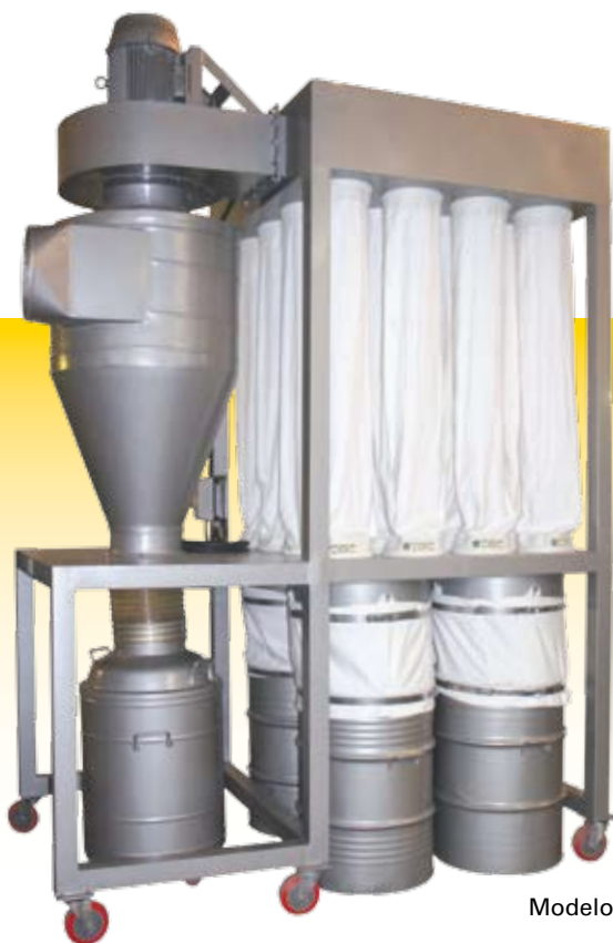
Modelo Ciclone - Tipo Tambor 150