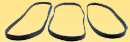
Guarnição de borracha p/ aspirador de pó