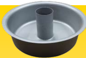
Depósito primário para aspirador