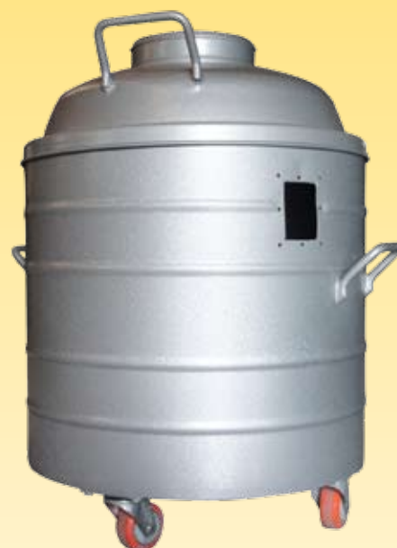
Tampa e tambor p/ coletor de pó mod. ciclone