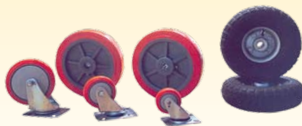
Rodas e rodízios